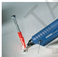
Закрепване на болтове на стена