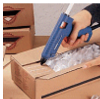
Запечатване на кутии от мукава

С привлекателната цена пистолета за топло лепене 3002 няма причина да не се възползвате от този модерен и многофункционален метод за лепене. Опростената употреба благодарение на механичния подавач на лепило и високите възможности за разтопяване правят този пистолет идеалният избор за човек, който иска да направи качествен ремонт вкъщи. За тази цел многофункционалният пистолет за топло лепене се доставя с пълен комплект за работа и лепене. В добавка към Gluematic 3002, този комплект върви с привлекателна пластмасова кутия, която съдържа 200 грама пръчки за лепене, както и подробно описание с множество съвети и предложения как да се използва пистолета при работа.