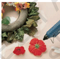
Аранжиране на цветя