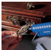
Прикрепяне на метални изделия