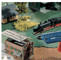
Направа на модели